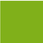
pantone 368C c50 m0 y100 k15