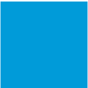
pantone 2925C c75 m20 y0 k0