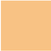
pantone 156C c0 m30 y50 k0