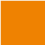
pantone 716C c0 m60 y100 k0